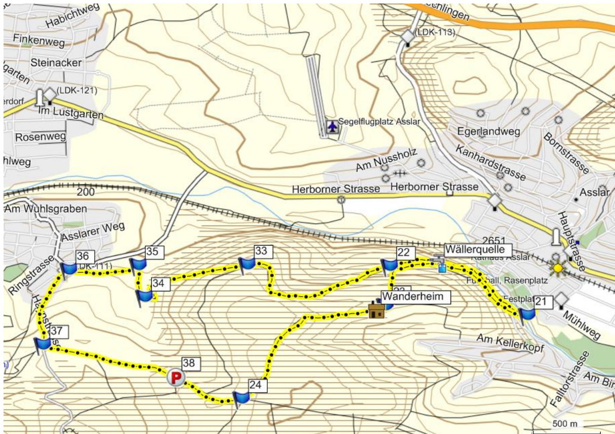
Map created with mkgmap-r1639 . Map data licenced under Creative Commons Attribution ShareAlike 2.0. OSM Street map. Program released under